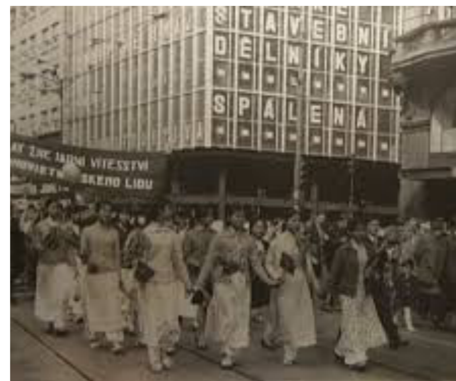
Vietnamští učni na Slovensku, vietnamský student, průvod vietnamských dívek před OD Máj